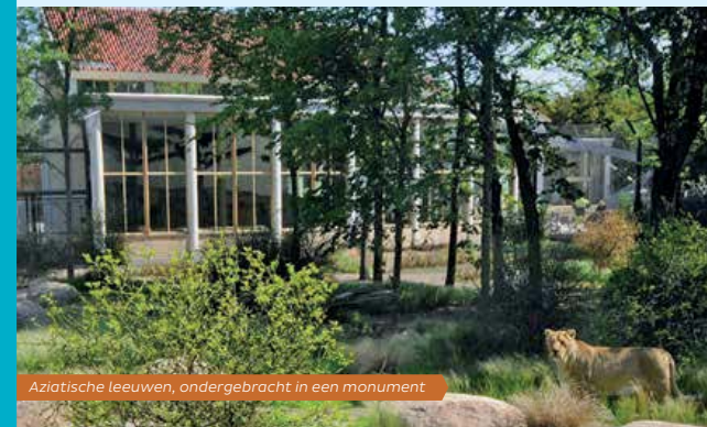
Aziatische leeuwen, ondergebracht in een monument

Al wandelend door de Diergaarde valt op dat het park op een bijzondere manier is aangelegd. De dieren leven in een zo natuurlijk mogelijke leefomgeving, hun biotoop. De biotopen zijn weer gerangschikt naar werelddelen. Deze trend is ingezet in 1988 en omschreven in het Masterplan. Maar de Diergaarde herbergt ook 21 waardevolle en unieke rijksmonumenten. Een groot deel daarvan is in de loop der jaren gerestaureerd, gemoderniseerd en onderdeel gaan