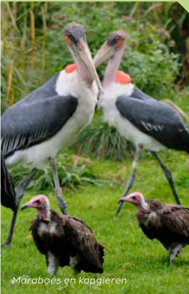
Maraboes en kapgieren