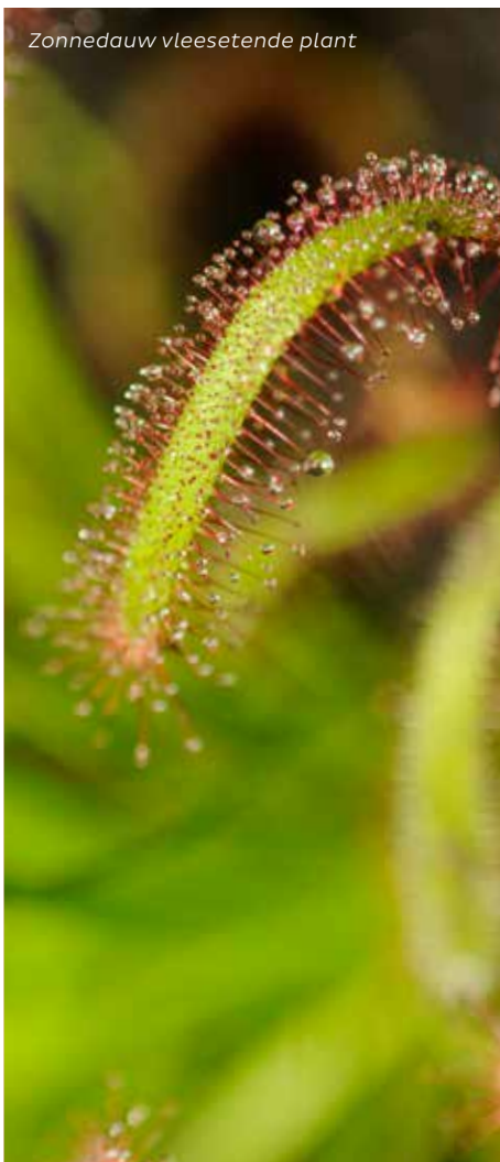
Zonnedauw vleesetende plant

Na je reservering ontvang je per gereserveerde les een bevestiging via de mail. Deze bevestiging is het bewijs van inschrijving en moet worden voorgelegd bij de kassa op de dag van het bezoek.