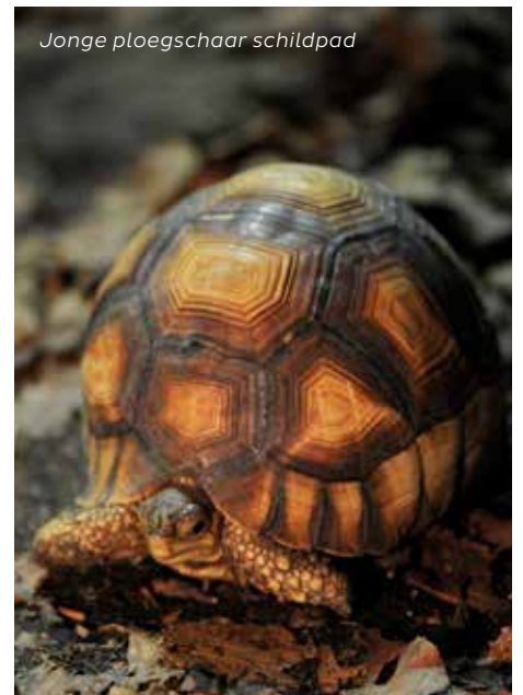
Jonge ploegschaar schildpad

Diergaarde Blijdorp beschikt over een parkeerterrein aan de Oceaniumzijde. In 2022 bedraagt het parkeertarief voor scholen € 6,00 per auto. Kom je in 2023, kijk dan op de site onder 'parkeren abonnementhouders' voor het juiste tarief.